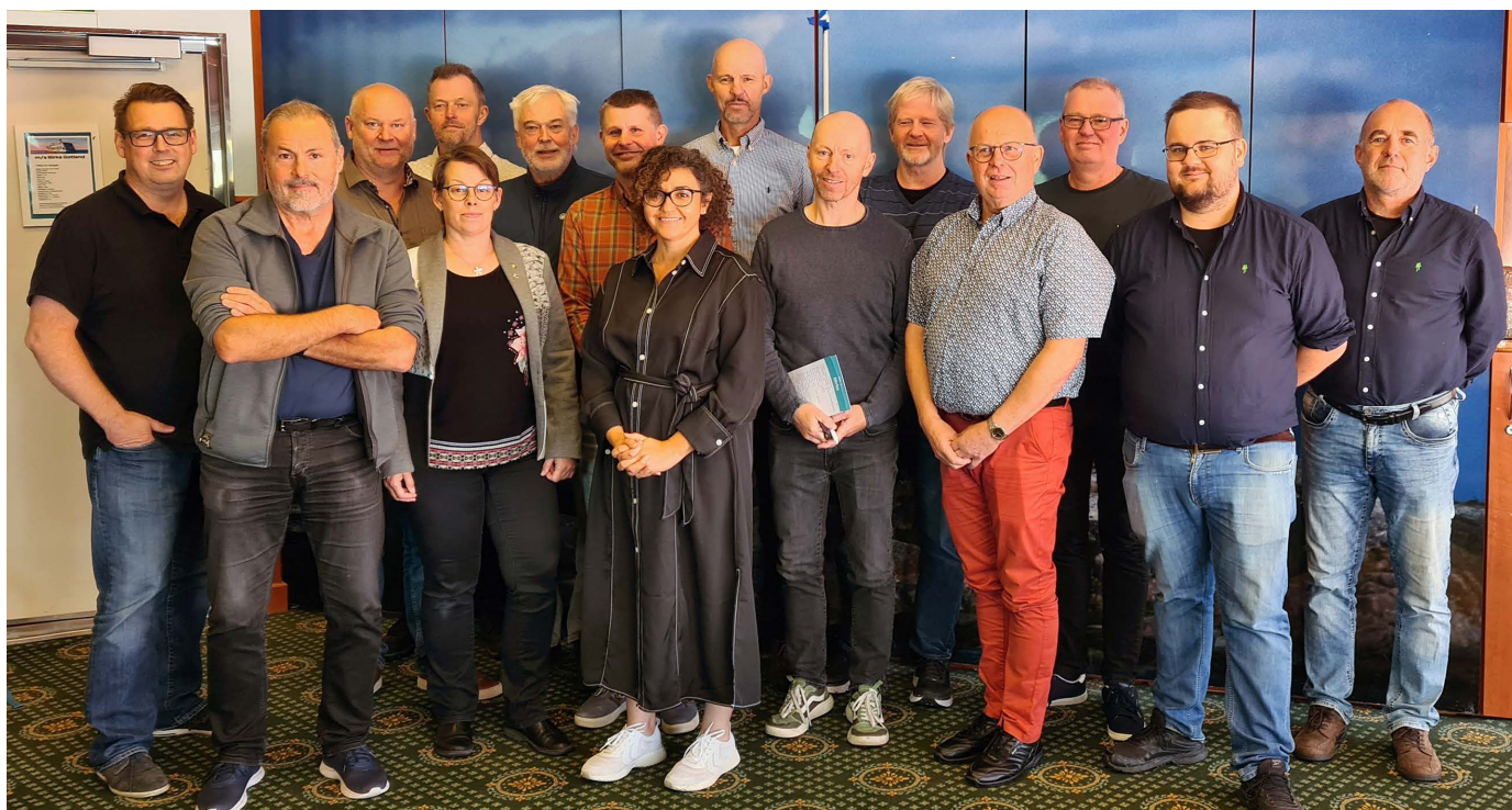
Deltagarna på årets Skogsbryn.